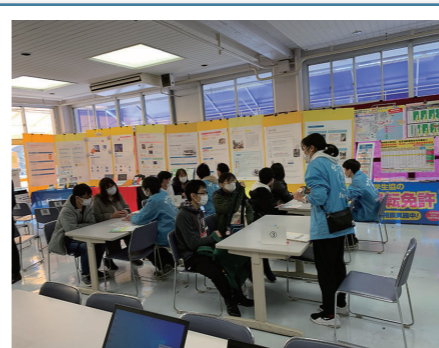
静岡大学での大学生活に必要なモノ すべてを1ヵ所で、1日で準備