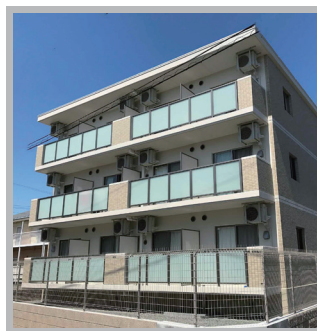
アンシャンテ (静岡)