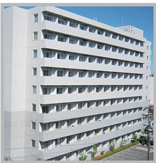
フィール城北 (浜松)