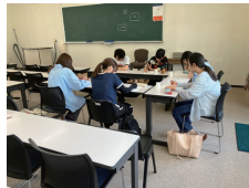
集団討論体験の様子