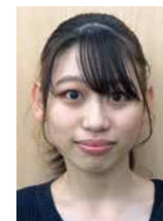
人文社会科学部 法学科 I.Aさん

私は当初大学生協推奨のパソコンを買うか迷っていました。パソコンは決して安いものではないし、大切に使うだろうから壊すことなんてないと思っていたからです。しかし実際に大学生活がスタートしてみるととても忙しく、特に私は委員会の仕事でパソコンでの作業とほかの作業を行ったり来たりしていたため、一回一回片づけることができませんでした。そこでパソコンを置いていた机にぶつかってしまっていたようで、気づいた時には机からパソコンが落下し、角が割れてしまいました。まだ使い始めて一年もたっていないパソコンが壊れたのはとてもショックでした。それだけでなく今は不具合がないが突然動かなくなるかもしれないという不安もあったため、生協ショップに持っていきと親切な対応で修理の手続きをしてくださりました。また、私はプレミアムサポートパックに入っていなかったため自己負担の免責金がかかってしまったので、迷っている人は加入をお勧めします!