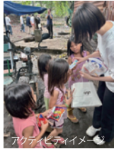
アクティビティイメージ

新興国では、社会制度の成熟度が追いつかず、インフラや廃棄物管理において様々な問題が発生しています。セブ市では、様々な種類の廃棄物が混合されたまま埋め立てられた結果、「スモーカーマウンテン」と呼ばれる状態に陥っており、環境・海洋汚染の問題も喫緊の課題として取り上げられています。今その課題に対し蓄積した技術・ノウハウを提供するグローバル企業担当者からレクチャーを受けます。また「スモーカーマウンテン」で生活をする子供達に、音楽とスポーツを通して学びや子供らしく遊べるように活動している特定非営利活動法人理事長より話を聞きます。