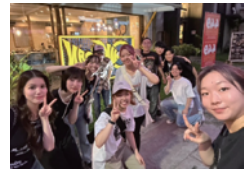
アクティビティイメージ