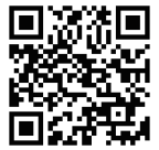
プログラム紹介動画

毎日朝食3食付き・数回のコースディナー(正装での参加) アクティビティ・エクササイズ参加時は、現地でランチ提供あり