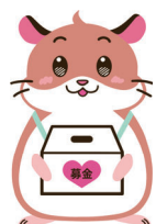
たすけあい奨学制度 キャラクター 「ヘルム」

1年前(2023年3月ご卒業)の先輩からは、99人から244,692円、2年前(2022年3月ご卒業)の先輩からは、40人から492,065円を、それぞれご寄付いただいています。卒業されるあなたからのご寄付をお願い申し上げます。