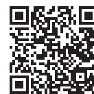
たすけあい奨学制度 Webページ