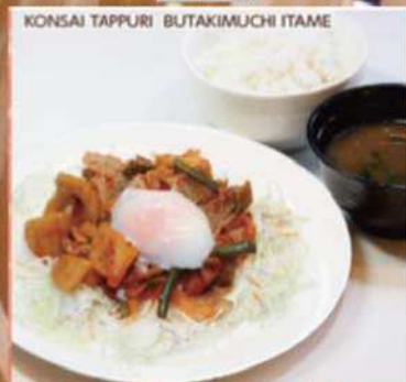
根菜たっぷり 豚キムチ炒め