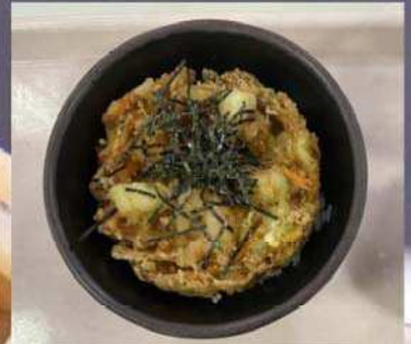
海鮮かき揚げ 天井