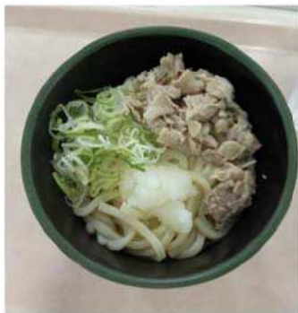
冷やし塩豚おろし うどん