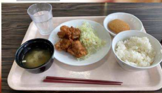
鶏唐揚げセット＋チーズ じゃがもち