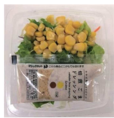
生協けんこうサラダ