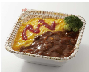
生協手作り丼「学食BENTO」

購買eM店で販売する「生協手作り丼」と「けんこうサラダ」に加え、「焼き立てパン」が食堂パスでご利用いただけます。