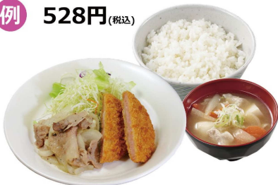
ハムカツ&塩だれ焼肉+ライス(中)+豚汁