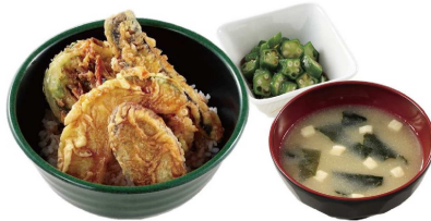
野菜天丼+豆腐とわかめの味噌汁+オクラのお浸し