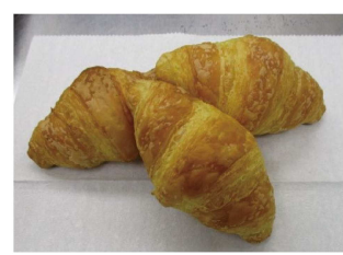
ベーカリー焼き立てパン