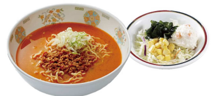
担々麺(中)+ポテト&コーンサラダ