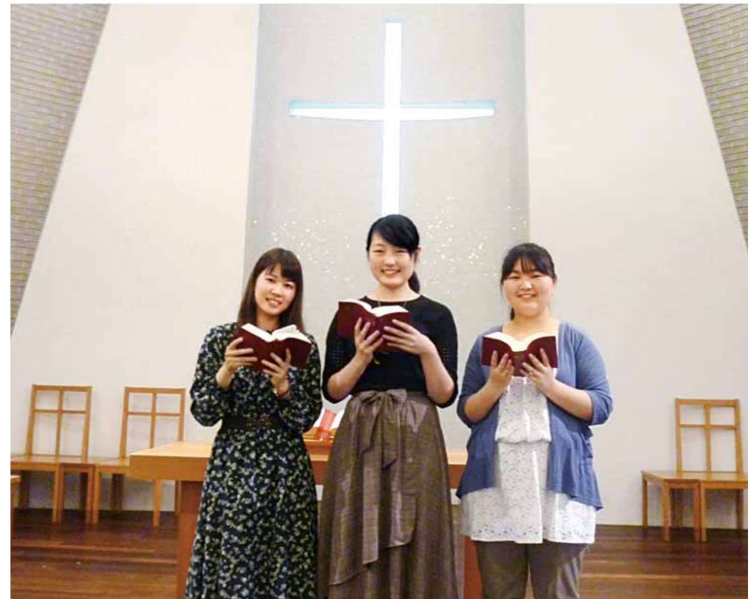
金城学院大学のみなさん

大学生協組合員の方の免許取得は毎年1万人以上の実績のある生協で お申込は大学生協のカウンターへ 大学生協はお得な組合員割引があります 自動車学校での直接のお申込は、生協組合員料金適用外となります。ご注意ください。